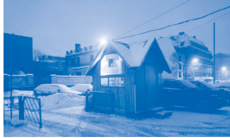
© Reinis Hofmanis, sans titre, série Territory, 2012

Fr 18 | nocturne 18.00 | Rundgang durch Freiburger Kunsträume