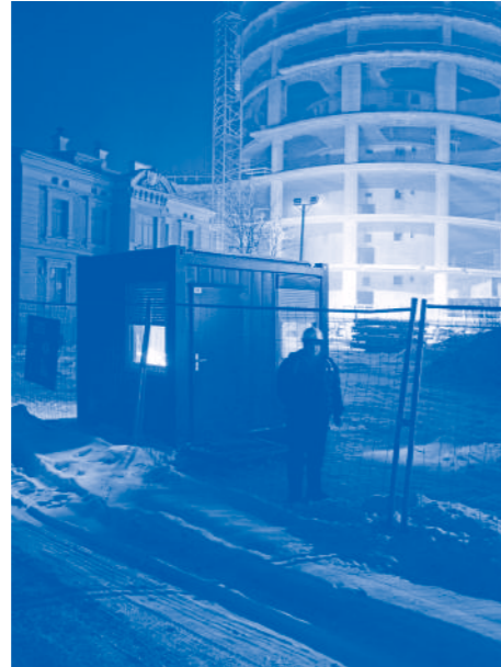
© Reinis Hofmanis, sans titre, série Territory, 2012

Do 08 | ARCHIFOTO - 19.00 | International awards of architectural photography édition 2012: Architektur ohne Grenzen Vernissage